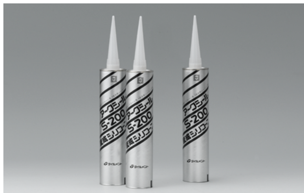
変成シリコン系シーリング材

浴室タイル、石材、人工大理石などの目地シーリングに適した、変成シリコン系の湿気硬化1成分形シーリング材です。