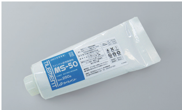
変成シリコーン樹脂系接着剤

保温・防音・断熱工用スピンドル鋸、FPファスナーを施工するのに適した変成シリコーン樹脂系接着剤です。空気中の湿気（水分）で反応・硬化する1液接着剤です。初期接着力及び施工性に優れています。