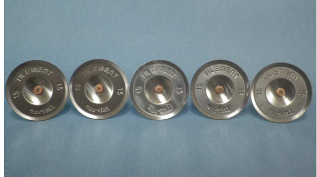
写真 2 : 試験後

●本試験成績書の記載内容は、当社の試験データを基に作成し、じゅうぶん信頼し得るものと確信しておりますが保証値ではございません。現場施工においては施工箇所の環境・使用材料・施工条件などが異なりますので、確実な施工を行なう為にも施工前に用途・条件などをご自身で十分ご検討下さい。