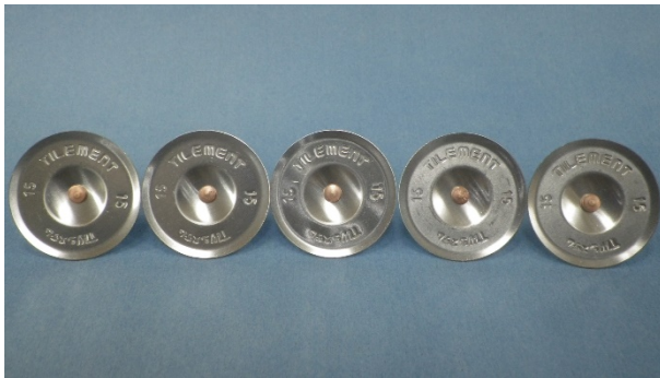
写真 1 : 試験前