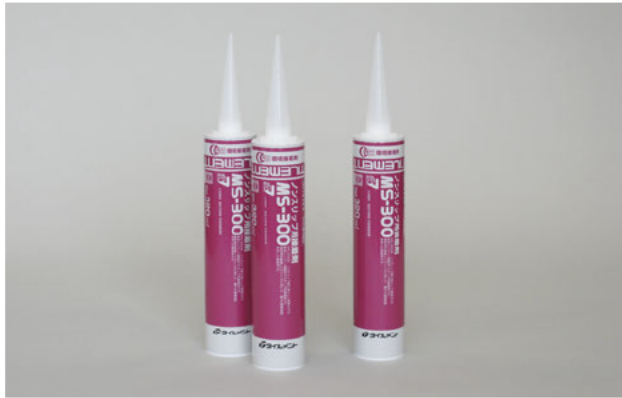
変成シリコーン樹脂系接着剤

MS-300は、ノンスリップ施工用として開発された変成シリコーン樹脂系マスチック形接着剤です。屋内外の階段用金属ノンスリップに対して、優れた接着性能を有した接着剤です。