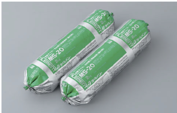
変成シリコン樹脂系接着剤

屋内壁面タイル・石材施工用として開発された、点付け施工用の一液反応硬化形の変成シリコン樹脂系接着剤です。硬化後は適度な硬さを保持することで、接着強さを確保しつつ、下地の変形やタイルの動きによる応力を緩和します。