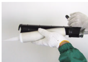
3.カートリッジガンに装着します。