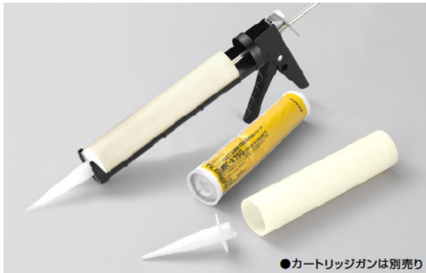
●カートリッジガンは別売り

梱包されているMK-475Gは変成シリコンポリマーを主成分とし、空気中の湿気（水分）で反応硬化し、硬化後はゴム弾性体となる1液形接着剤です。