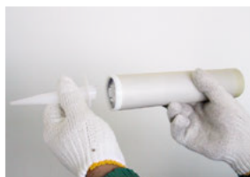
2.ノズルを差し込みます。