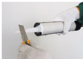
4.ノズル先端をカットします。