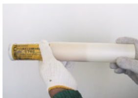
1.ホルダーにMK-475Gを挿入します。