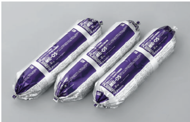
変成シリコン樹脂系接着剤

屋外壁面へのタイル・石材施工用(落下防止金物併用)として開発された、一液反応硬化形の変成シリコン・エポキシ樹脂系接着剤です。硬化性に優れ、硬化後は適度な硬さを保持することで、接着強さを確保しつつ、下地の変形や仕上げ材の動きによる応力を緩和します。