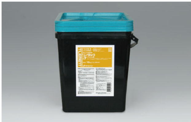
アクリル樹脂系エマルジョン形接着剤

リノリウム用に開発された無溶剤タイプのアクリル樹脂系エマルジョン形接着剤です。初期接着性に優れた片面塗布形です。