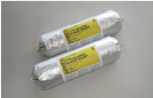
変成シリコン・エポキシ樹脂系接着剤

一液反応形の内外壁タイル張り用接着剤です。初期の硬化が速いため、目地詰めまでの養生時間が短縮できます。硬化後はゴム状の弾力性を持ち、下地の変形に追随します。