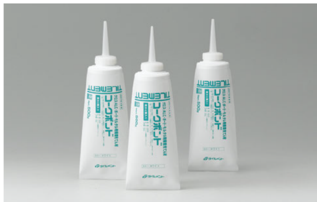
アクリル樹脂系エマルジョン形接着剤・シーリング材

コークボンドは塩ビクロスなどに対する接着性に優れ、乾燥後は弾性体となりホコリの付着による汚れの心配のないアクリルエマルジョン系のシーリング材です。水性塗料の上塗りもでき、クロス施工時の隙間シールや天井・壁・柱との隙間充てん、各種ボード類の充てん補修に適しています。