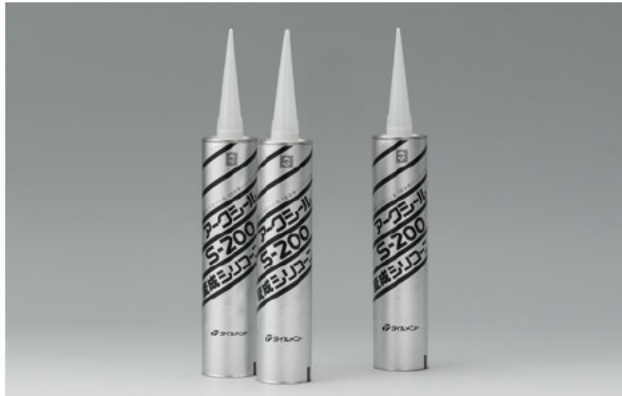
変成シリコーン系シーリング材

浴室タイル、石材、人工大理石などの目地シーリングに適した、変成シリコーン系の湿気硬化1成分形シーリング材です。