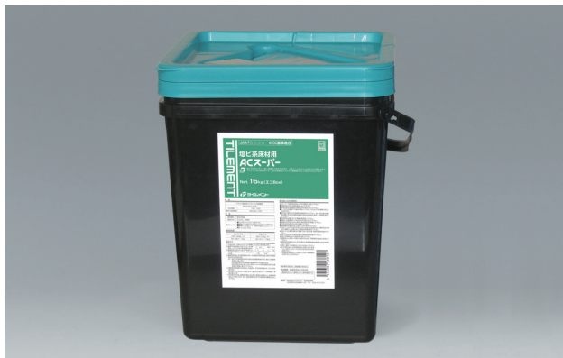
アクリル樹脂系エマルジョン形接着剤

ビニル系床材に対して高い接着性を持つアクリル樹脂系エマルジョン形接着剤です。 耐水工法用として開放廊下にも施工可能な水系の接着剤ですので低臭かつ安全です。