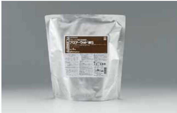
変成シリコーン樹脂系接着剤

フローウッドMSは、木質系直張り遮音床材の施工に適した変成シリコーン樹脂系接着剤です。専用コテを用いることで安定した接着性を発揮し、接着剤の塗布量を抑制することができます。また、硬化物が柔らかいため、床材表面に付着した場合でも容易に除去できます。